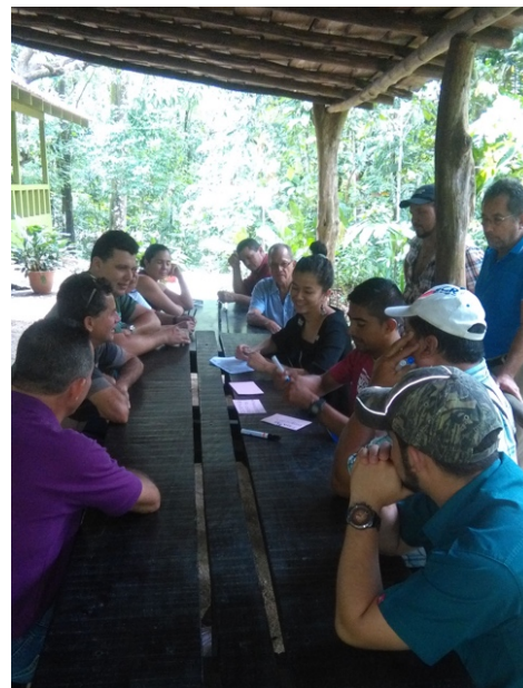
Discusión grupal para determinar prioridades de mejora. Cámara de Ganaderos de Hojancha.

Por último, se revisó y actualizó cada marco estratégico incorporando un enfoque empresarial y de auto gestión. En las cámaras que carecían de plan estratégico, se formularon los principales componentes de un marco estratégico empresarial, a fin de orientar las acciones y procesos por desarrollar en los próximos cinco años.